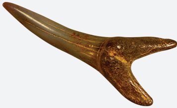
Dent de requin