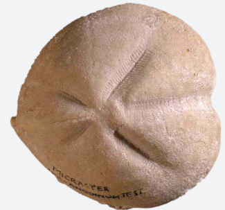
Oursin de mer