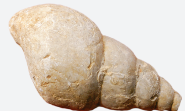
Escargot de mer